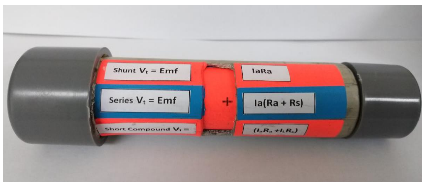
Rajah 2: Setting Formula in Cylinder untuk Chapter 2

Daripada persamaan V_T = \text{Emf} + I_a R_a