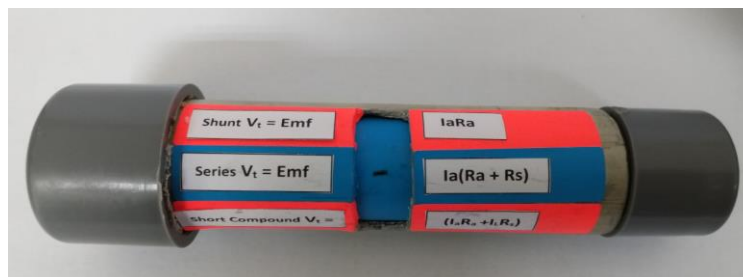
Rajah 1: Setting Formula in Cylinder untuk Chapter 1